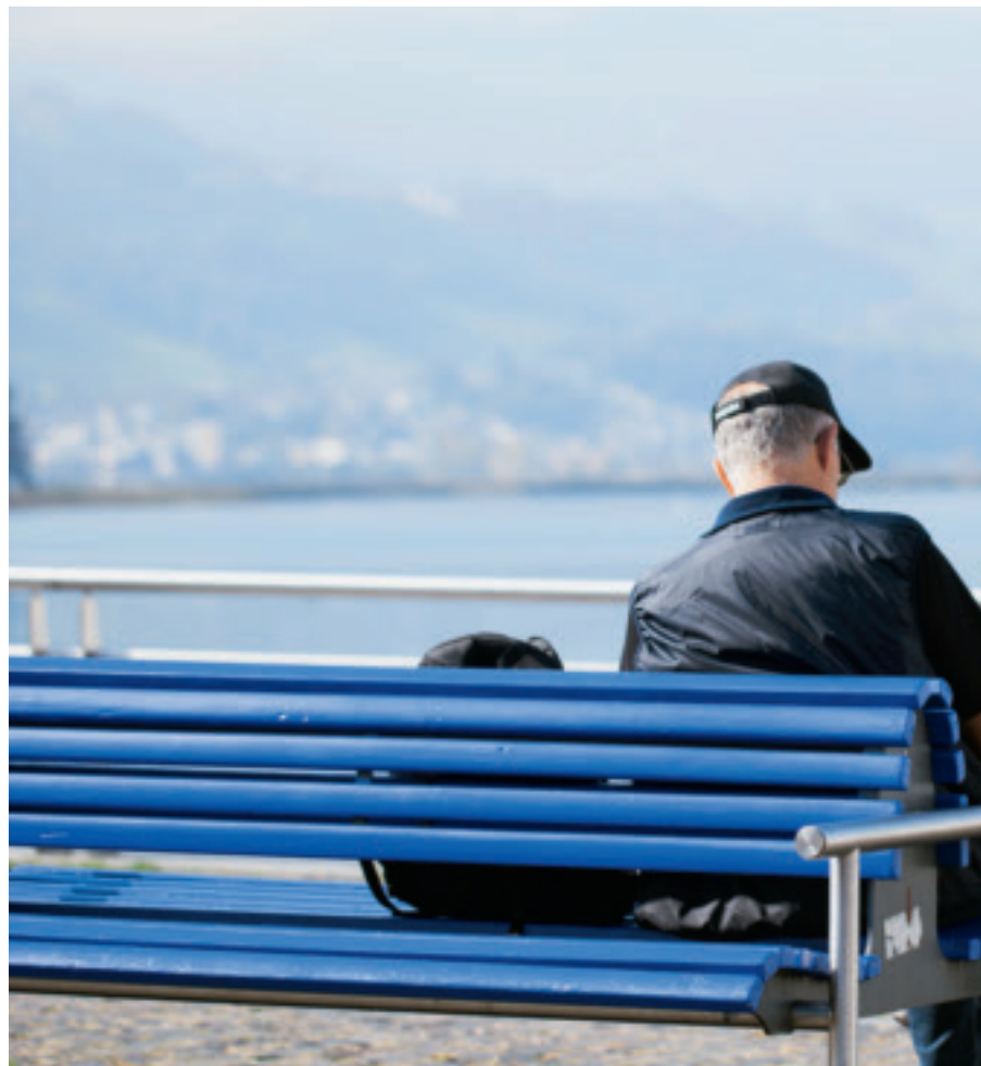
Bänke sind wichtig für die Möblierung des öffentlichen Raums.

Fast 350 öffentliche Sitzbänke stehen auf dem Stadtgebiet von Rapperswil-Jona, wie Werkdienstchef Leo Rüegg weiss (siehe Karte). Sind das nun viele? Oder eher zu wenige? Das fragt sich der Zeitgenosse, der sie benutzt, wohl selten. Die Bänkli sind ja einfach da. Wie wichtig sie sind, würde man wohl erst →