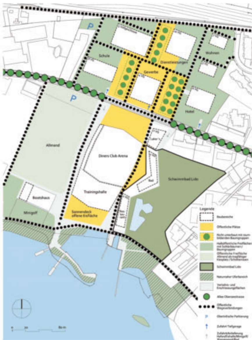
Hotel, Berufsschule und verdichtetes Wohnen: Das Lido-Areal soll besser genutzt werden.

sind auch betriebliche Synergien zwischen Eisanlagen und Schwimmbad: Die Kühlaggregate für das Kunsteis werden auf die Seite des Schwimmbades verlegt, sodass mit der gleichen Energie auch das Freiluftbad geheizt werden kann. ■