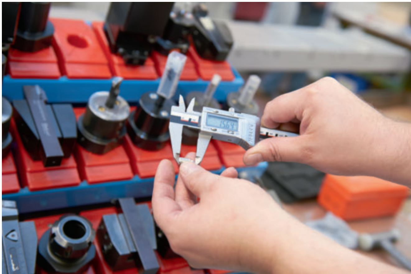
Präzision wird in der Industriewerkstatt der Stiftung Balm grossgeschrieben.