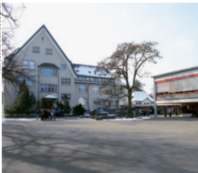
Bald 100-jährig: das Oberstufenschulhaus Burgerau.

Es ist eines der jüngeren Schulhäuser in Rapperswil-Jona, aber eines, das Geschichte schrieb: Das Oberstufenschulhaus Burgerau war das erste eigene Schulhaus der 1906 gegründeten Sekundarschulgemeinde Rapperswil-Jona. Getragen wurde diese von den beiden Primarschulgemeinden katholisch Rapperswil und evangelisch Rapperswil-Jona. Während der ersten Jahre wurden die Schülerinnen und Schüler der Sekundarschule allerdings noch im Schulhaus am Herrenberg unterrichtet. 1915 durften sie und ihre Lehrer ins neu erstellte Schulhaus an der Burgerastrasse umziehen.