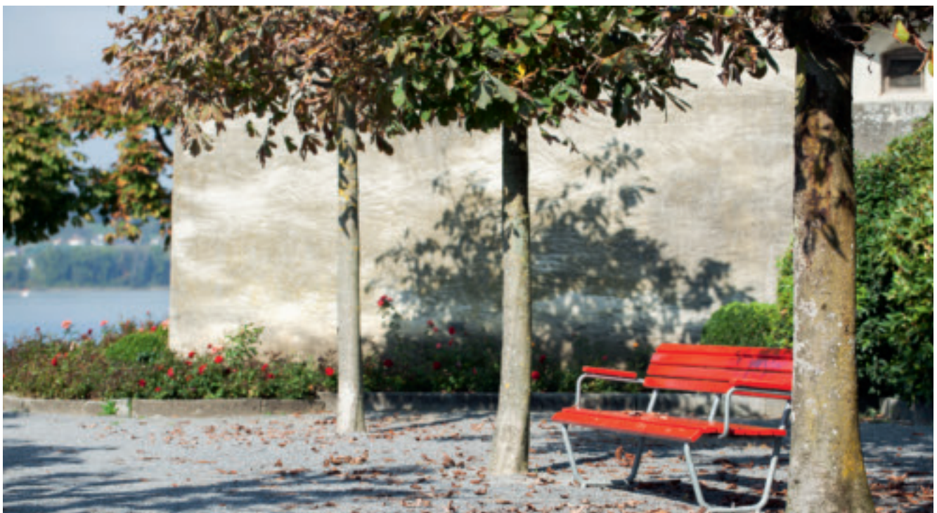
Rote Holzbänkli sind in Rapperswil-Jona klar in der Mehrzahl: 227 Stück gibt es davon.