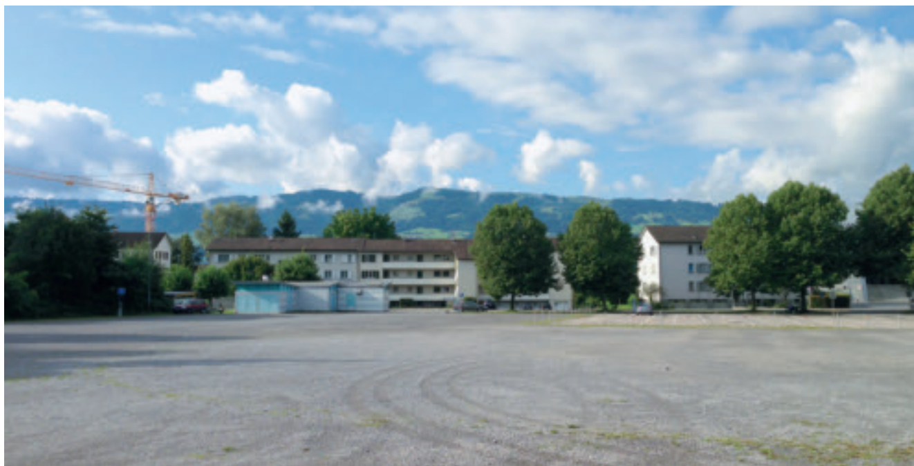
Wenn nicht gerade der Circus Knie hier Premiere feiert, bietet der Para-Parkplatz ein trostloses Bild.