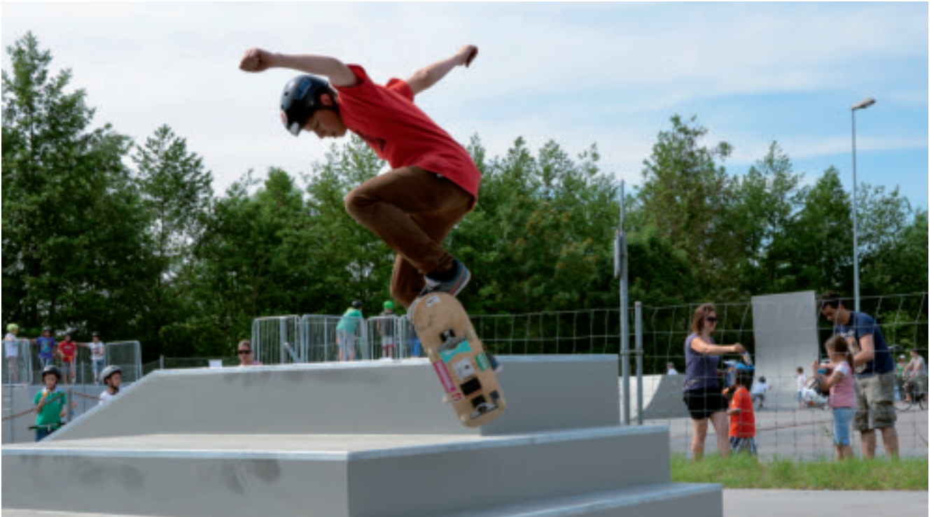
Mit der Eröffnung der Skateranlage ist für viele Jugendliche ein lange gehegter Wunsch in Erfüllung gegangen.

konferenz stattfinden, damit die Kinder und Jugendlichen ihre Bedürfnisse vorbringen können.