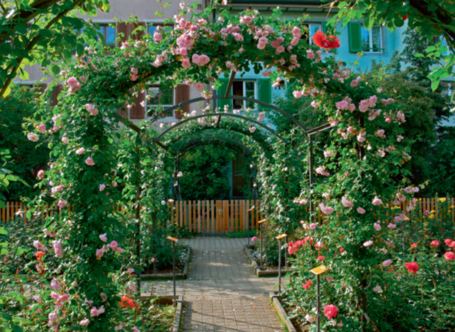
Die Rosengärten gehören zu den Aushängeschildern von Rapperswil-Jona.