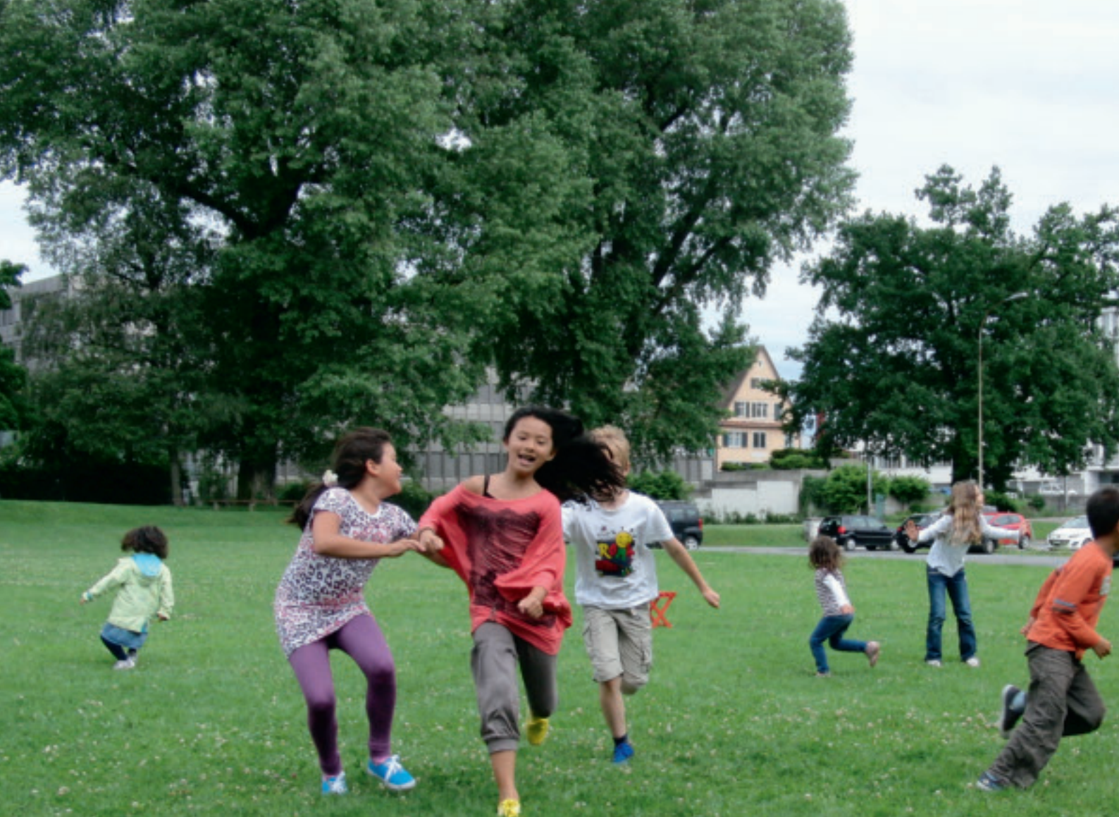
Kinder brauchen Raum, um nach Herzenslust herumtollen zu können.