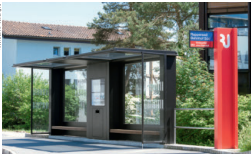
Die neuen Bushaltestellen kommen bei den Fahrgästen gut an.

Im September und Oktober dieses Jahres wurden 16 Bushaltestellen in Rapperswil-Jona neu gestaltet; darunter sämtliche Haltestellen an der Schachen- und an der Alten Jonastrasse. Damit wurde eine weitere Etappe des Konzeptes Bushaltestellen umgesetzt, nach dem bis 2016 rund 120 Haltestellen, die stark frequentiert sind, neu ausgestattet werden sollen. Dabei geht es zum einen um Anpassungen im Sinne der Behindertengerechtigkeit, zum andern soll der Komfort für die Fahrgäste erhöht werden. Und schliesslich will die Stadt