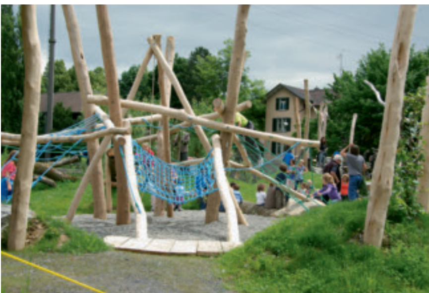
Beliebt: Der Drachenspielplatz an der Schlüsselstrasse.