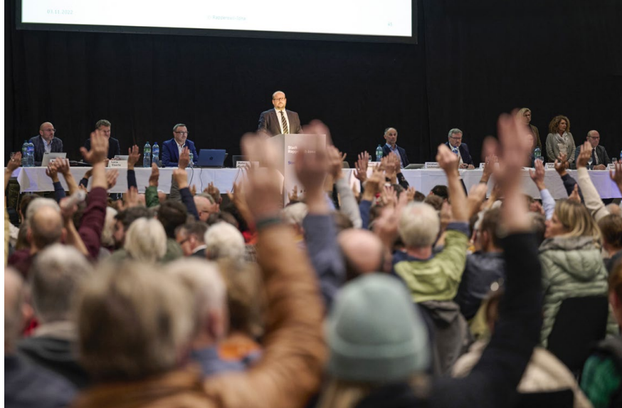
Eine Vorlage, zahlreiche Abstimmungen: Immer wieder befanden die Stimmberechtigten über Anträge aus dem Kreis der Anwesenden.