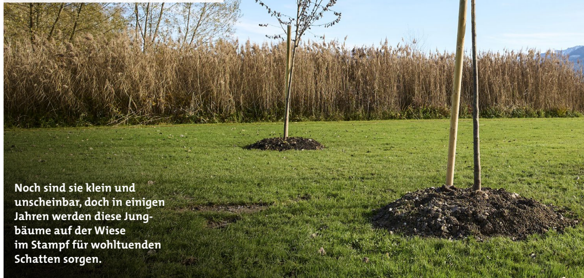
Noch sind sie klein und unscheinbar, doch in einigen Jahren werden diese Jungbäume auf der Wiese im Stampf für wohltuenden Schatten sorgen.