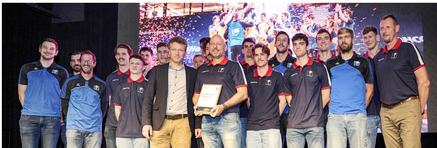
Die Volleyballer des TSV Jona durften für ihre herausragenden Leistungen den Preis für Elitesport entgegennehmen.