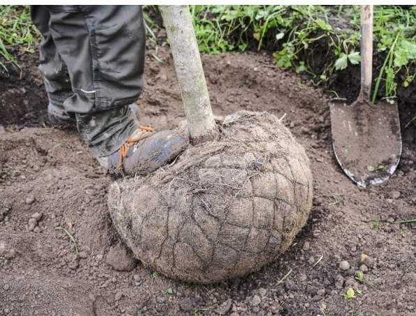
Eine Baumwurzel braucht Platz: Rund zwei Meter breit sollte die ausgehobene Grube sein.

Die Installation der Anlagen erfolgte durch das EWJR, pro Gebäude dauerte sie im Schnitt etwa einen Monat. Die Panels wurden alle bereits im Frühling 2022 bestellt und stammen aus Schweizer Produktion. Damit werde der einheimische Markt berücksichtigt, heisst es seitens des Fachbereichs Infrastruktur. Ausserdem greife man auf das Schweizer Know-how zurück und verursache keine langen Transporte. (jo)