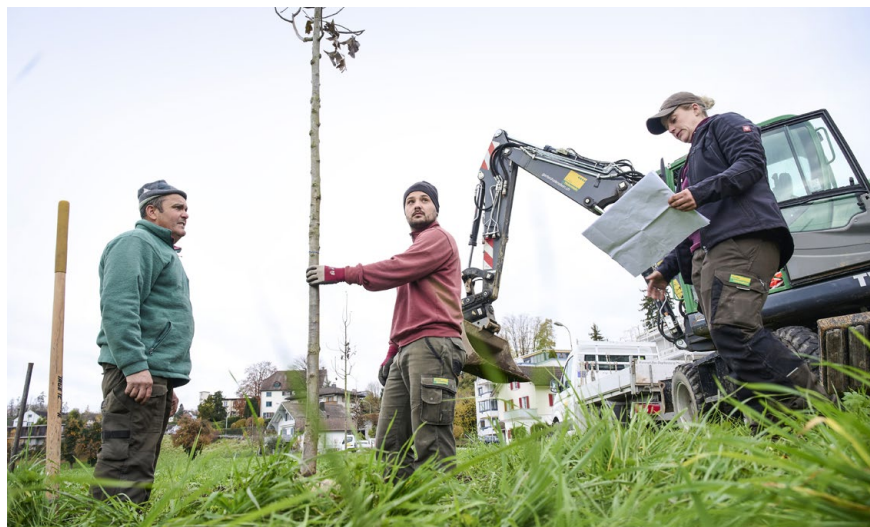
An welcher Stelle genau der Baum in die Erde kommt, gibt jeweils ein genauer Plan vor.