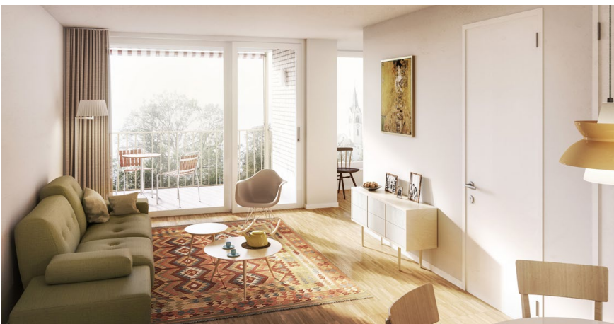
Das Angebot reicht von Zweieinhalb- bis Viereinhalbzimmerwohnungen – alle hell und freundlich.

Die ersten 40 Alterswohnungen im Spitzacker entstanden bereits 1980, 2001 kamen 20 weitere hinzu. Mit den 51, die nun gebaut werden, wird das Wohnungsangebot also nahezu verdoppelt. Die neue Pflegewohnung wird zehn Betten mehr bereithalten als die bestehende. Dieser Ausbau soll nun zugleich der letzte sein an diesem Standort. Die derzeitigen Planungen sehen vor, dass der Porthof West ab Mitte 2021 bezogen werden kann. (jo)