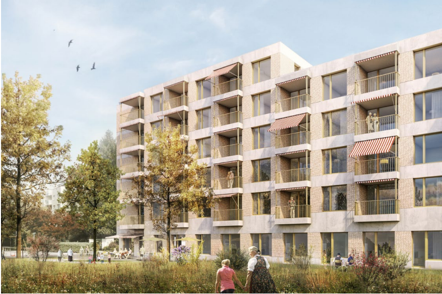
Mit dem Neubau Porthof West wird das Angebot an Alterwohnungen im Spitzacker fast verdoppelt. Ausserdem entsteht eine grosse Pflegewohnung. (Visualisierung: zvg)