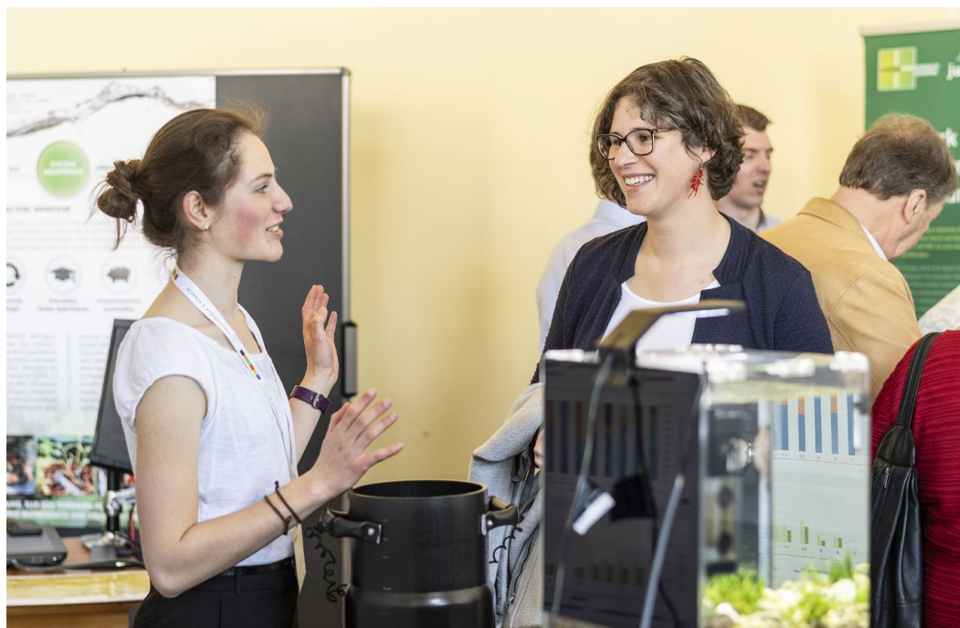
Der nationale Wettbewerb bietet jungen Forscherinnen und Forschern eine Plattform, um ihre Arbeiten zu präsentieren.

Die Finalistinnen und Finalisten durchlaufen alle ein mehrstufiges Selektionsverfahren. Lediglich rund die Hälfte aller im Herbst 2018 angemeldeten Arbeiten schaffte es an den Schweizer-Jugend-forscht-Workshop im Januar 2019. Dort stellten die Jungforschenden der Jury ihre Ergebnisse in Kurzvorträgen vor und besprachen danach die Arbeiten eingehend mit den Expertinnen und Experten. Nachdem diese Hürde gemeistert war, mussten die meisten der Jugendlichen ihre Arbeit noch perfektionieren, um definitiv zum Final zugelassen zu werden. Die rund 120 Jungforscherinnen und Jungforscher, die in Rapperswil-Jona ihre Projekte präsentieren werden,