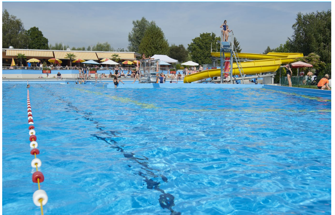
Im Schwimmbad Lido kann vorläufig weiterhin gebadet werden.

Die Expertise moniert vor allem die Führung und die Koordination des Projekts durch die Gesamtleitung, die den Architekten aus Zürich oblag. Die Rede ist von widersprüchlichen Planungsständen der einzelnen Planer, von einer mangelhaften Abstimmung von Kontrollen und Konsolidierungen von Arbeitsergebnissen sowie von fehlenden oder falschen Kosteninformationen. In Bezug auf die Stadt kommt die Expertise zum Schluss, dass ihr eine klare Definition der Projektanforderungen sowie ein griffiger Prozess zur Überprü-