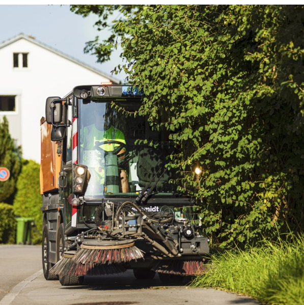
Wenn das Grün zu sehr wuchert, kommt die Wischmaschine nicht mehr durch.

Aus all diesen Gründen ist der Unterhalt von Hecken, Bäumen und Sträuchern im öffentlichen Raum eine zentrale Aufgabe des Werkdienstes. Namentlich auf Schulwegen oder bei