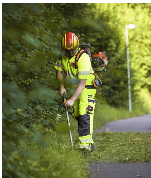
Mit dem Freischneider wird erst das Gras am Trottoirrand geschnitten.