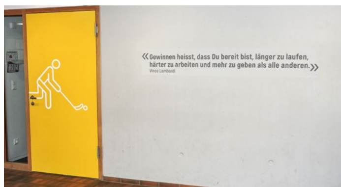
Seit Kurzem zieren Illustrationen und bekannte Zitate Türen und Wände in der Sportschule.

An der Sportschule Rapperswil-Jona hat man die eigene Leistung inzwischen auch gegen aussen sichtbar gemacht – mit Sport- und Schul-Logos auf den Zimmertüren sowie dem Swiss-Olympic-Logo an der Aussenfassade und auf Fahnen. An den Innenwänden finden sich bekannte Sport- und Motivationszitate. (red)