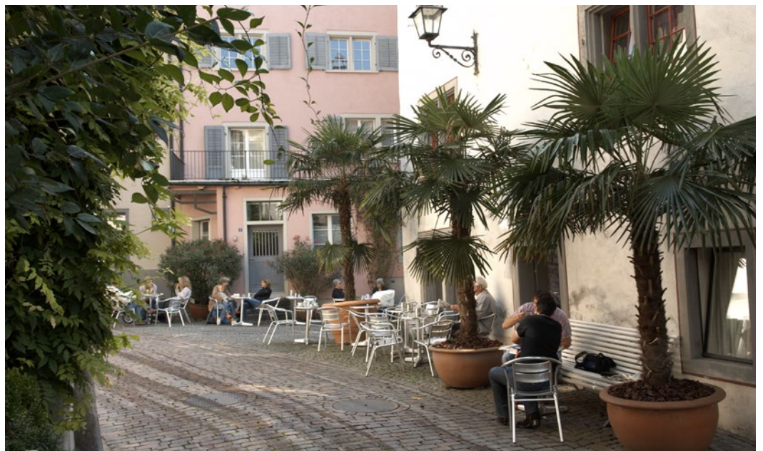
Für eine lebendige Altstadt wurden in einem dreiteiligen Workshop Massnahmen beschlossen.

Mieten seien für viele Ladeninhaber und Gewerbetreibende ein Problem. Damit dieser Dialog in einem zweiten Schritt in Gang gesetzt werden kann, sieht der Bauvorsteher auch die Stadt in der Pflicht. (red)